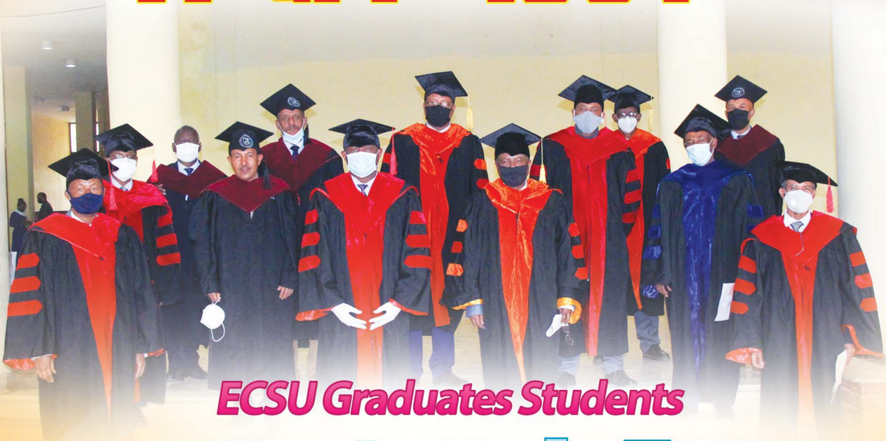
ECSU Graduates Students