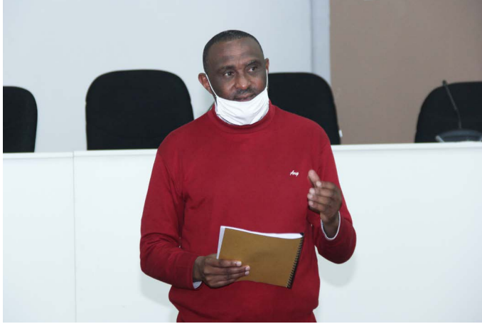
ፕ/ር ፍቅሬ ደሳለኝ የኢትዮጵያ ሲቪክ ሰርቪስ ዩኒቨርሲቲ ፕሬዚዳንት