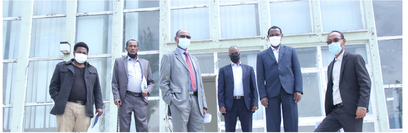
የ10 አመት ስትራቴጂክ እቅድ ኮሚቴ አባላት