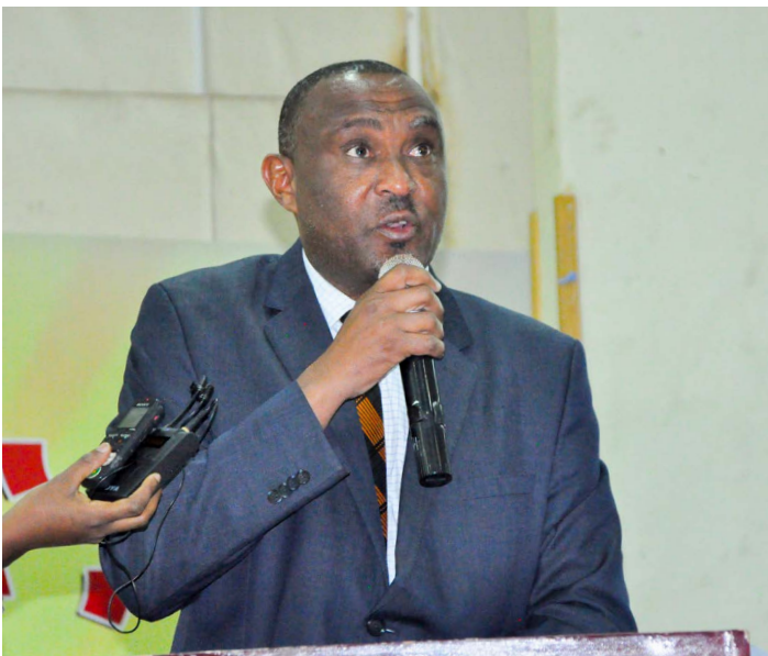
ፕ/ር ፍቅሬ ደሳለኝ የኢሲሲዩ ፕሬዚዳንት

የኢትዮጵያ ሲቪል ሰርቪስ ዩኒቨርሲቲ ሰራተኞች 15ኛውን የብሔር ብሄረሰቦችና ሕዝቦች ቀን “እኩልነትና ሕብረ-ብሄራዊ አንድነት ለጋራ ብልጽግና” በሚል ሙሪ ቀል ከ23/3/2013-24/3/2013 ዓ.ም በአባይ አዳራሽ በተለያዩ ዝግጅቶች አከበሩ።