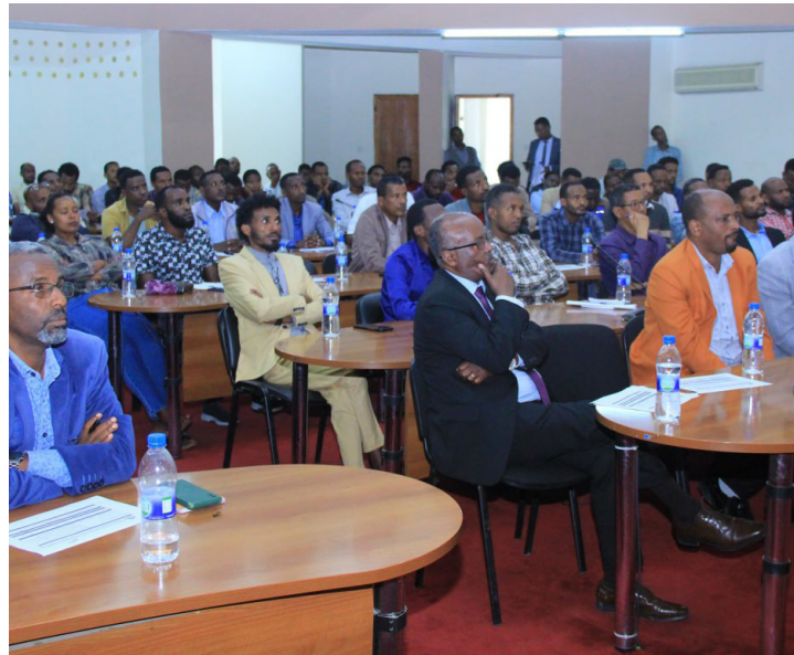
የኢሲሲዩ የከተማ ልማት እና ምህንድስና ኮሌጅ ተመራቂ ተማሪዎች ስልጠና ተሰጠ