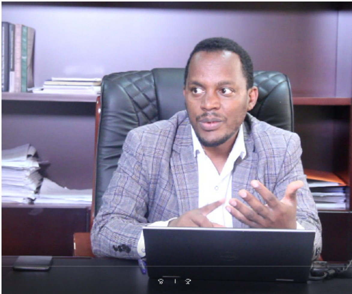
ዶ/ር ታዴዎስ ሜንታ የአስተዳደርና ልማት ዘርፍ ም/ል ፕሬዚደንት

ይገባል? የሚከለክሉ ነገሮች ምንድን ናቸው? የሚለውን በሙሉ ለሰራተኞቻችን በማብራራት ሂደቱን ጀምረናል። በመቀጠል በተለይ የስራ ልምድ በሚጠይቁ ስራ መደቦች ላይ ግልጽ አረዳድ ለመያዝ እንዲያስችል፤ በምዝገባ ወቅት ቀጥታ የስራ ልምድ ማለት ምን ማለት እንደሆነ፤ ለመወዳደር ምን ምን የስራ ልምድ ሊኖራቸው እንደሚገባ፤ በሚመዘገቡበት ጊዜ ለውድድር ሊያበቃቸው የሚችል የትምህርት ዝግጅት የትኛው እንደሆነ በመወያየት እና ግልጽ በማድረግ፤ ከሚቴው ታላላቅ ወስዶ እያንዳንዱን የተሰጠንን መደብ እንደገና በማየት፤ ለእያንዳንዱ የስራ መደብ ቀጥታ የስራ ልምድ የተባሉትን በሙሉ ለይቶ ለማኔጅመንቱ በ ማ ቅ ረ ብ ፣ አ ስ ተ ያ የ ት አ ሰ ጥ ተ ና ል ፡ ፡ አስተያየት ከተሰጠበት በኋላም እንደገና ማሻሻያ በማድረግ መልሱን ለ ማ ኔ ጅ ሙ ን ቱ በማቅረብ እንዲወሰን አድርገናል። ከዚህ በኋላ በተደረገው ማሻሻያ ላይ እንደገና ለሰራተኛው ገለጻ ተደርጎ፤ ቀጥታ የስራ ልምዶች በሚባሉት ላይ ግልጽ አረዳድ እንዲኖር አድርገናል፤ በ ተ ጫ ማ ሪ ም በ ማ ኔ ጅ ሙ ን ት የጸደቀው እና በኮሚቴ የተፈረመው ለ ሰ ራ ተ ኛ ው በሚታይ ቦታ እንዲለጠፍ ተደርጎ፤ በዚህ መሰረት የውድድር ምዝገባው ተካሂዷል ።