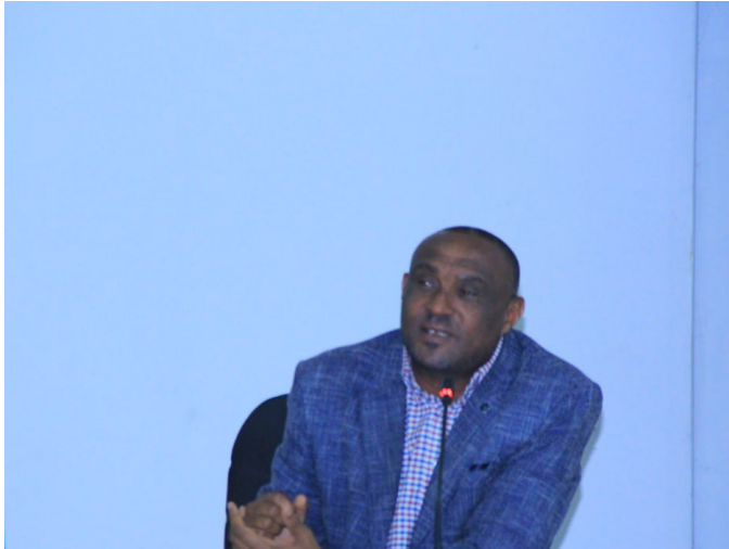
ፕ/ር ፍቅሬ ደሳለኝ የኢትዮጵያ ሲቪል ሰርቪስ ዩኒቨርሲቲ ፕሬዚዳንት

በግምገማ መድረኩ መክፈቻ ላይ የኢትዮጵያ ሲቪል ሰርቪስ ዩኒቨርሲቲ ፕሬዚዳንት ፕ/ር ፍቅሬ ደሳለኝ ባደረጉት የመክፈቻ ንግግር የግምገማ መድረኩ የበጀት ዓመቱ ማጠቃለያ እንደመሆኑ መጠን የዩኒቨርሲቲውን የዓመቱን ሙሉ ገጽታ የሚያሳይ የግምገማ መድረክ እንደሚሆን ለካውንስሉ ገልጸዋል። በማስከተልም ቀደም ሲል በመንግስት በተፈቀደው በጀት ላይ 346 ሚሊዮን ብር ተጨማሪ በጀት ተገኝቶ በዩኒቨርሲቲው ታሪክ ለመጀመሪያ ጊዜ በሚባል ደረጃ ከፍተኛ በጀት ከመንግስት የተመደበበት፤ አጠቃላይ በጀቱም 837 ሚሊዮን ብር የደረሰበትና ይህንንም በጀት በተሳካ ሁኔታ ለመማር ማስተማር፣ የምርምር፣ የማማከር ፣ የስልጠና እና ለአስተዳደር ስራዎች ጥቅም ላይ የዋለበት ዓመት መሆኑን ገልጸዋል። ከሪፎርም ዕቅድ አንጻርም ዩኒቨርሲቲው ሁለት አንኳር የሪፎርም አጀንዳዎችን አየተገበረ መሆኑን ያነሱት ፕ/ር ፍቅሬ እንደ ምርምር ዩኒቨርሲቲ የምርምር ዩኒቨርሲቲ ሊያሟላቸው የሚገቡ መስፈርቶችን በተጠቃሚ ለማሟላት እና በቅርብ ዓመታት ውስጥም ራስ-ገዝ ዩኒቨርሲቲ መሆን ለማተኮር በርካታ ስራዎች የተሰሩ መሆናቸውን፤ ወደ የራስ-ገዝነት የሚደረገው ጎዘውም በአንድ ጊዜ የሚደረግ ሳይሆን በሥራ አመራር ቦርድ በሚሰጠው የጊዜ ሰሌዳ መሰረት በሶስት ምዕራፎች ማለትም በመጀመሪያ የአካዳሚያዊ ነጻነትን በማረጋገጥ፣ ቀጥሎም የሰው ሀብትን የማስተዳደር ነጻነት