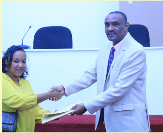
የኢሲሲዩ ያስገነባቸውን የንግድ ሱቆች ለተጠቃሚዎች አስተላለፈ