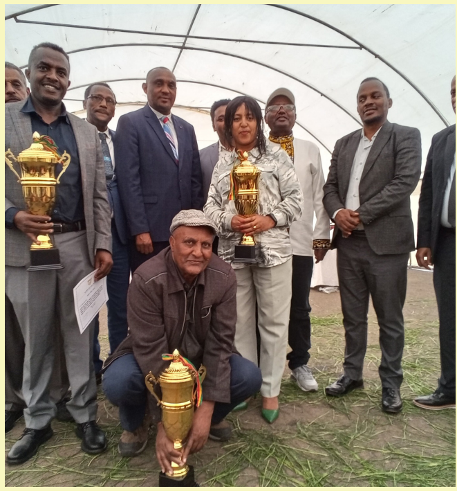
2016 የበጀት ዓመት የላቀ ውጤት ላመጡ የስራ ክፍሎች ሽልማት ተሰጠ