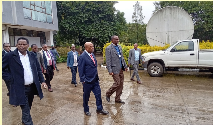
የትምህርት ሚኒስቴር ሚኒስትር የኢትዮጵያ ሲቪል ሰርቪስ ዩኒቨርሲቲን ጎበኙ

Committed to Excellence in the Public Sector!