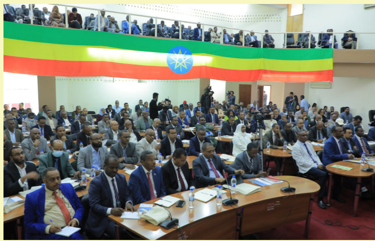
33ኛው ሀገር አቀፍ የትምህርት ጉባኤ በኢሲሲዩ ተካሄደ