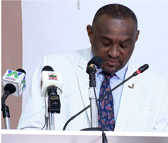
ፕ/ር ፍቅሬ ደሳለኝ የኢትዮጵያ ሲቪል ሰርቪስ ዩኒቨርሲቲ ፕሬዚዳንት

33ኛው ሀገር አቀፍ የትምህርት ጉባኤ “ፍትሃዊና ጥራት ያለው ትምህርት ለሁሉም” በሚል መሪ ሃሳብ የከፍተኛ ትምህርት ልማት ዘርፍ መድረክ በኢትዮጵያ ሲቪል ሰርቪስ ዩኒቨርሲቲ ነሀሴ 23 ቀን 2016 ዓ.ም በህዳሴ አዳራሽ ተካሄደ።